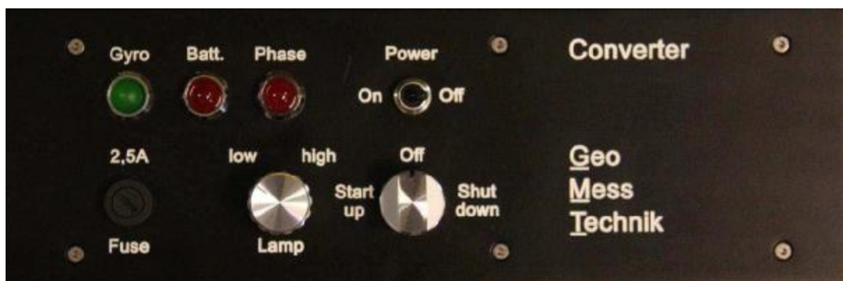
Рисунок 3 – Панель управления конвертера гиронасадки